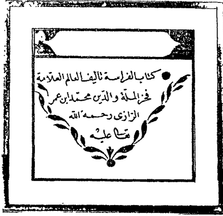
الصفحة الأولى من المخطوطة