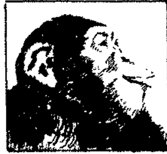
(شكل ٢) أثر الانفعال على الحيوان