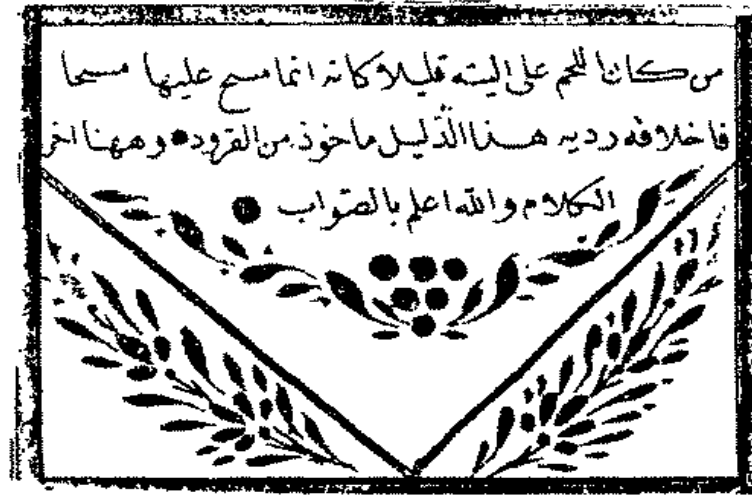
الصفحة الأخيرة من المخطوطة